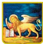
PATROCINIO REGIONE DEL VENETO